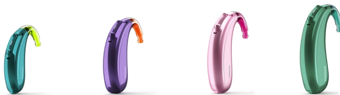
スカイ L-M スカイ L-M トライアル