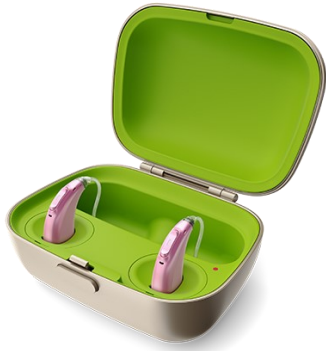
フォナック チャージャー Combi BTE /2

この充電器には、イヤモールド収納部、USB-Bの充電差込口、インジケータライトが付いています。蓄電できるパワーパック（別売）を取り付けることも可能です。