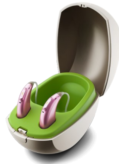
チャージャー BTE RIC

この充電器には、イヤモールド収納部、USB-Bの充電差込口、インジケータライトが付いています。蓄電できるパワーパック（別売）を取り付けることも可能です。